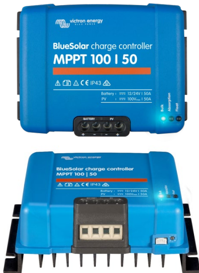
Solar Lade-Regler MPPT 100/50